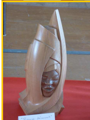
Atelier Roger Douville